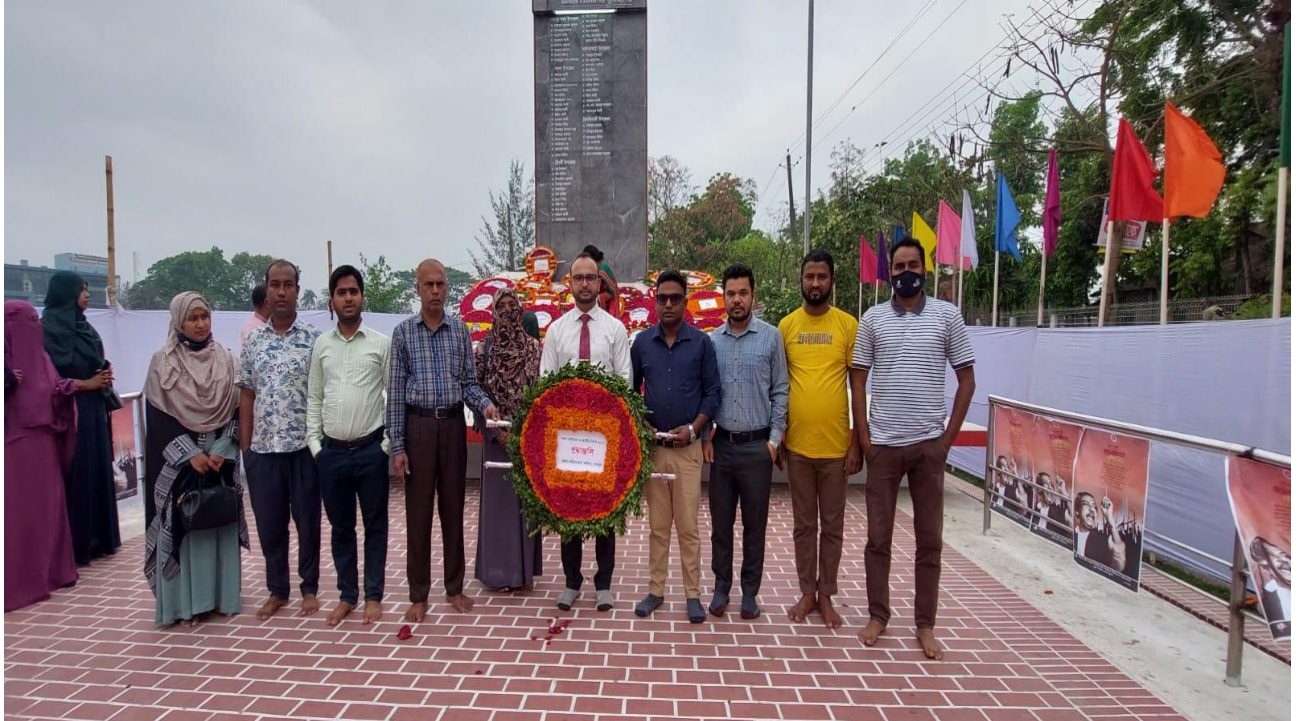
স্বাধীনতা দিবসে পুষ্পস্তবক অর্পন