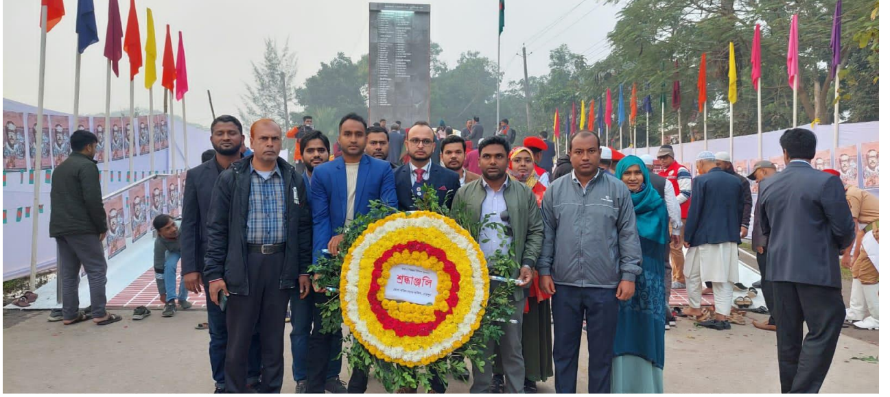
১৬ই ডিসেম্বর বিজয় দিবসে পুষ্পস্তবক অর্পনের খন্ড চিত্র