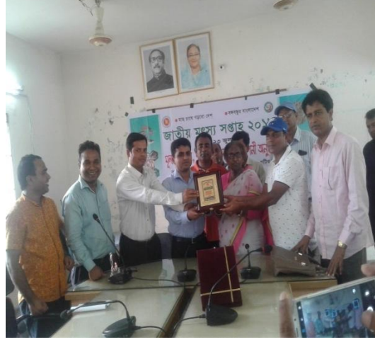
সফল মাছ চাষীদের পুরস্কার বিতরণের স্থির চিত্র ।