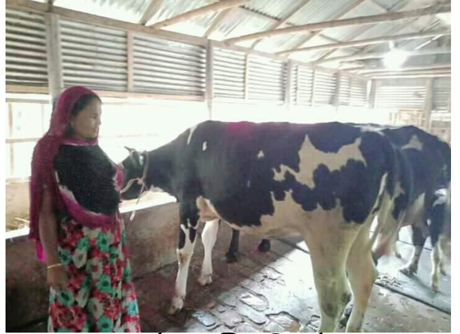
ঋণের চেক বিতরণ ও সমিতির সদস্য আয়মলা কর্তৃক গাভী পরিচর্যা করন

০২। আশ্রয়ন, আশ্রয়ন (ফেইজ-২) ও আশ্রয়ন - ২ প্রকল্পের ঋণ কার্যক্রমের